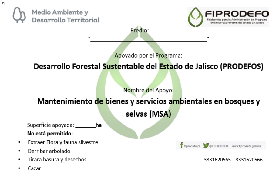
Imagen 1. Ejemplo del letrero alusivo al proyecto que deberá instalarse en el predio motivo del apoyo.